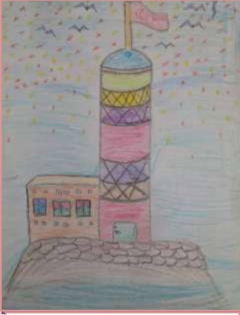
AYŞE KARAKUŞ 7-A