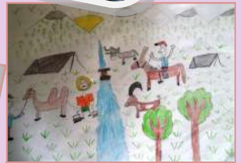
SEVİLAY BALTA 6-A