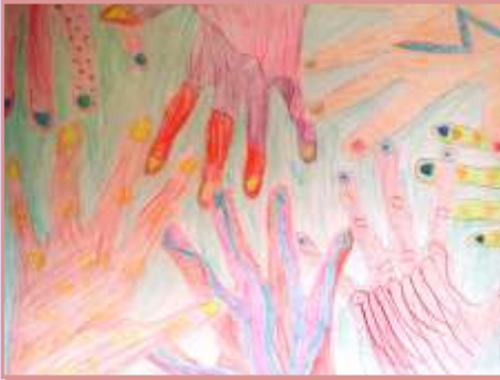
SEDEF YAĞCIOĞLU 6-A