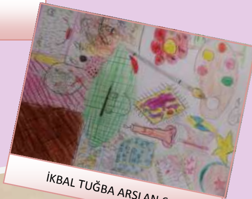
İKBAL TUĞBA ARSLAN 6-A