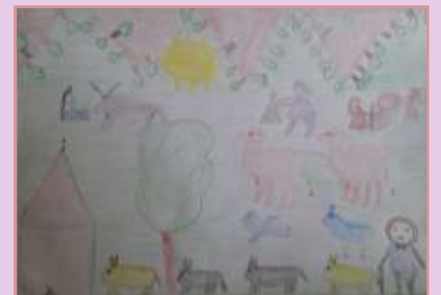
SULTAN KÖKEN 7-A